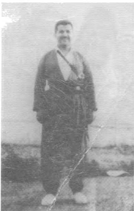
سهره‌تای سییه‌کانی ژیان